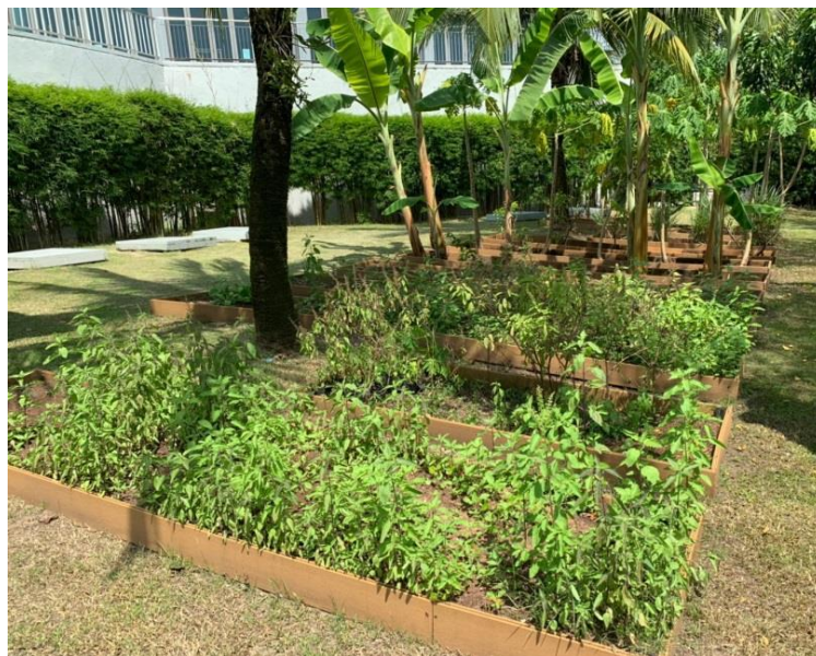
ภาพที่ 30 แสดงพื้นที่สีเขียวของโครงการ