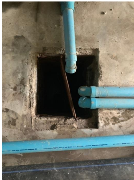
ภาพที่ 12 แสดงตะแกรงคัดขยะ