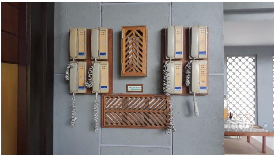
ภาพที่ 24 แสดงโทรศัพท์ภายในอาคารเมื่อลิฟต์มีปัญหา