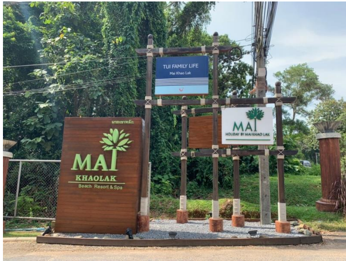
ภาพที่ 1 แสดงป้าย “ทางเข้าโครงการ”