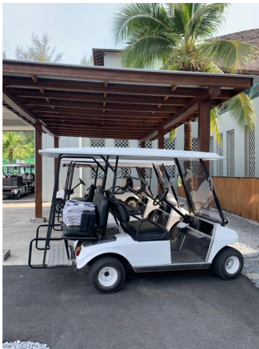
ภาพที่ 4 แสดงที่จอดรถกอล์ฟสำหรับรับ-ส่งแขกภายในโครงการ