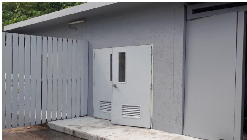
ภาพที่ 14 แสดงบริเวณห้องพักขยะ