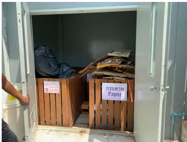
ภาพที่ 17 แสดงห้องพักขยะรีไซเคิล