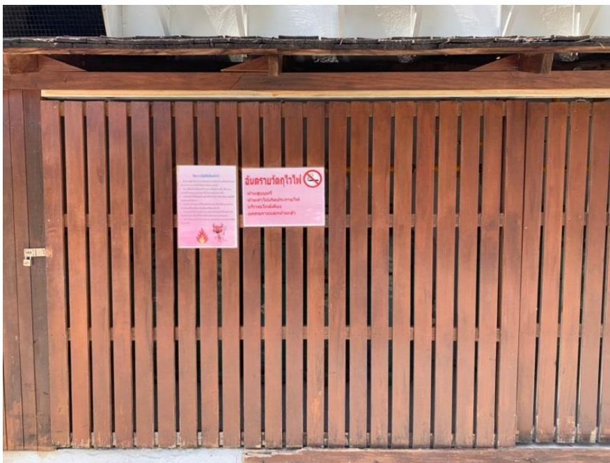
ภาพที่ 25 แสดงป้าย “วัตถุไวไฟ” บริเวณที่เก็บก๊าซหุงต้ม