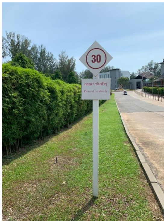
ภาพที่ 2 แสดงป้าย “จำกัดความเร็วไม่เกิน 30 กิโลเมตร/ชั่วโมง”