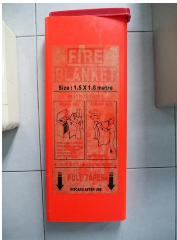
ภาพที่ 32 แสดงผ้ากันไฟ Fire Blanket