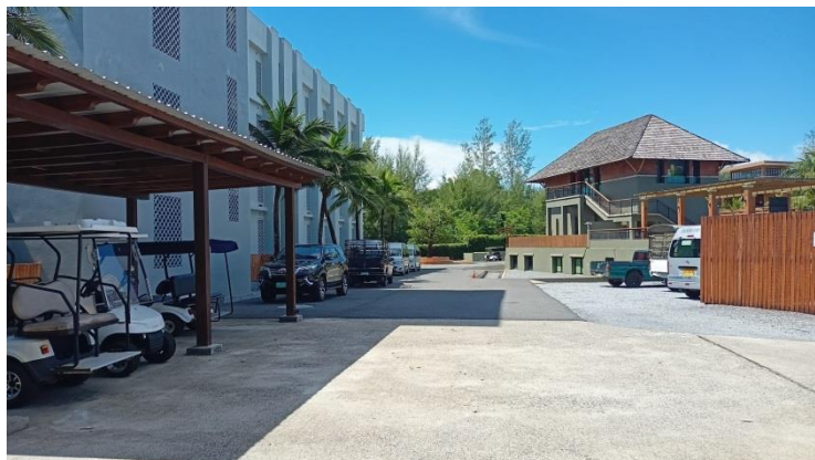
ภาพที่ 8 แสดงที่จอดรถ