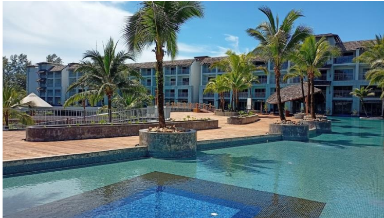
ภาพที่ 29 แสดงทัศนียภาพของโครงการ