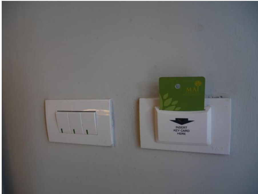
ภาพที่ 23 แสดง Key Tag ภายในห้องพักแขก