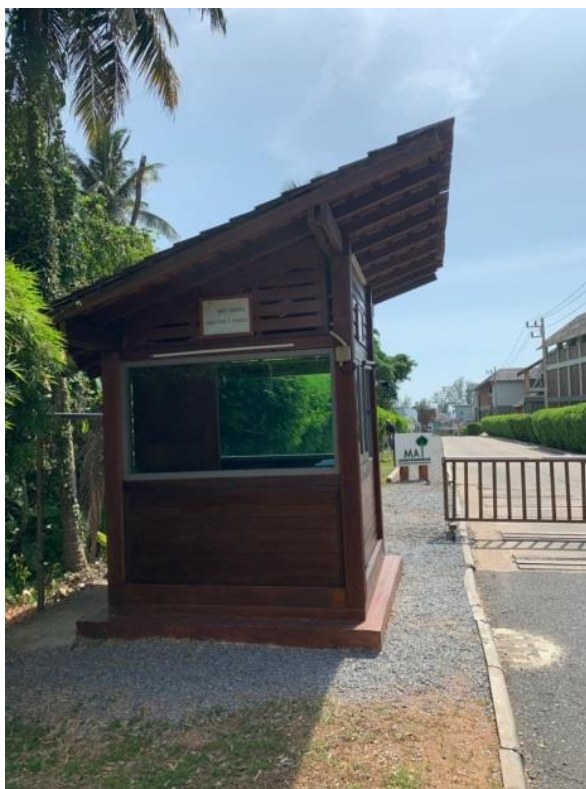
ภาพที่ 27 แสดงจุดรวมพล