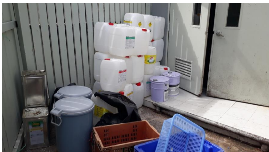
ภาพที่ 16 แสดงห้องพักขยะอันตราย