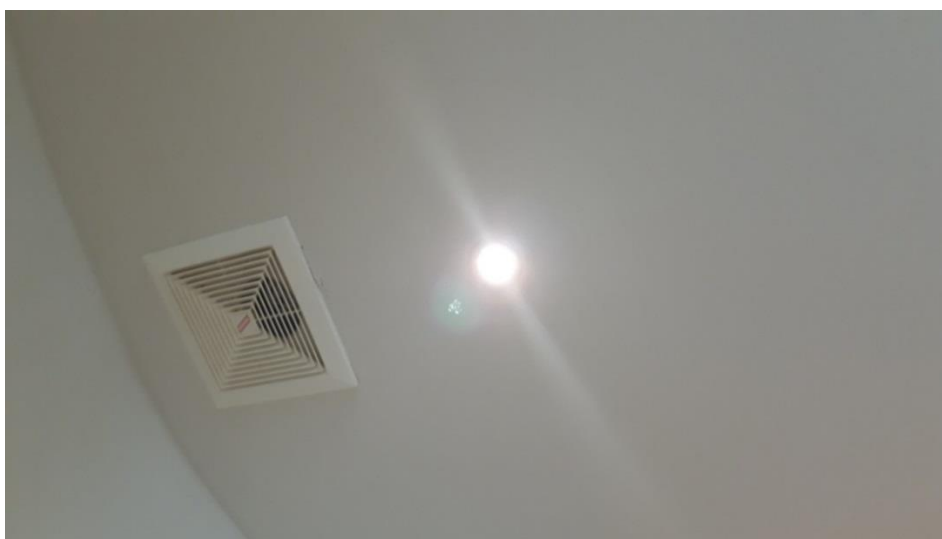
ภาพที่ 20 แสดงพัดลมดูดอากาศและหลอดประหยัดไฟฟ้าชนิด LED ภายในห้องพัก