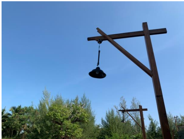
ภาพที่ 7 แสดงไฟส่องทางเดินภายในโครงการ