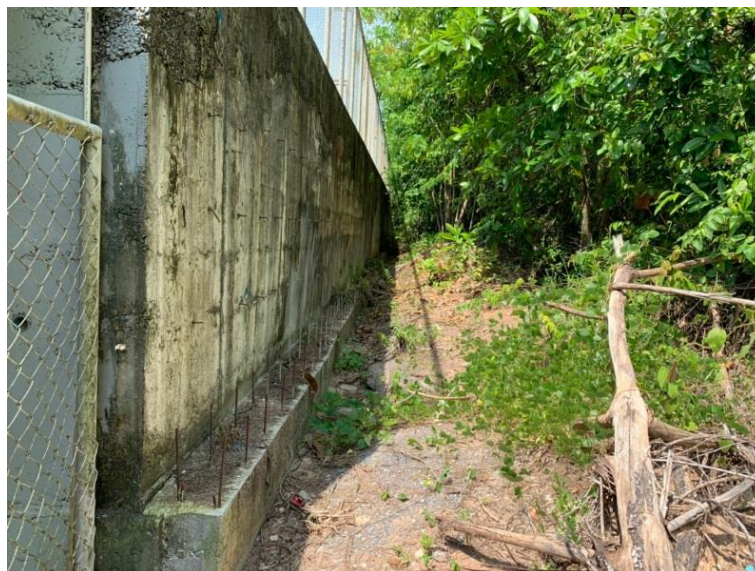
ภาพที่ 6 แสดงกำแพงกันดิน