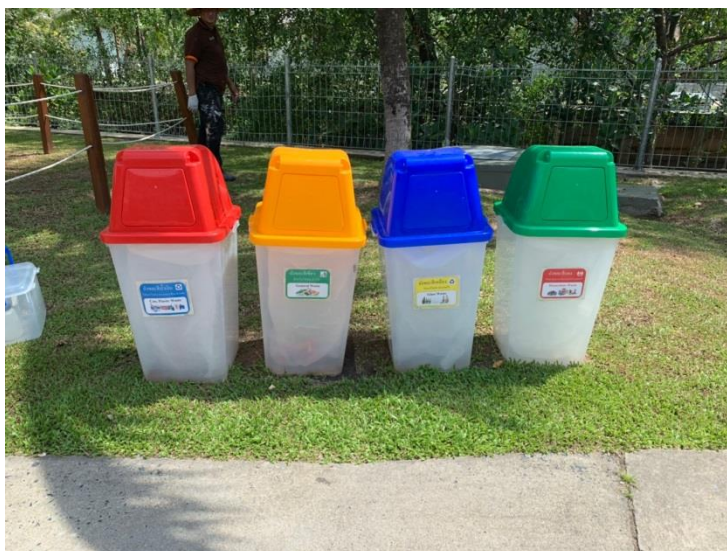
ภาพที่ 18 แสดงถังขยะภายในโครงการ