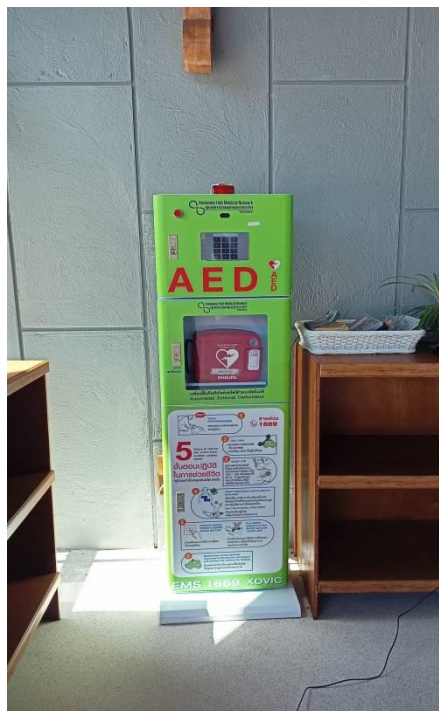
ภาพที่ 34 ตู้ปฐมพยาบาล