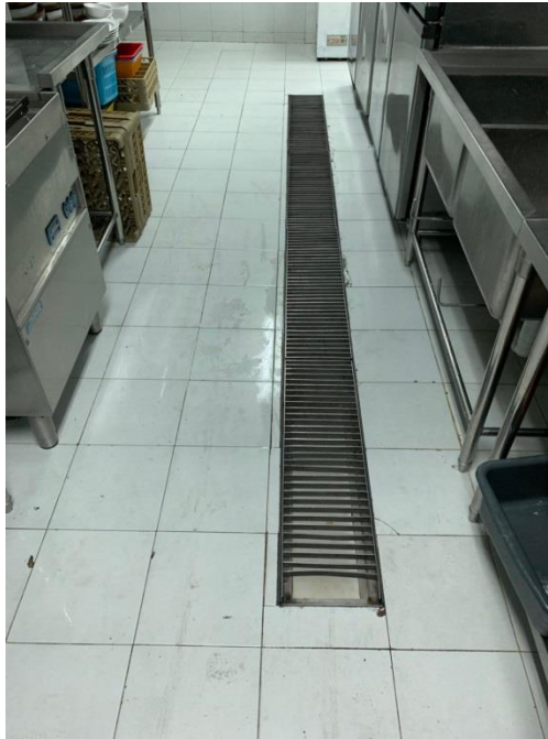
ภาพที่ 13 แสดงรางระบายน้ำภายในห้องครัว