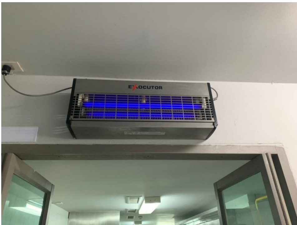
ภาพที่ 19 แสดงไฟล่อแมลงบริเวณห้องครัวภายในโครงการ