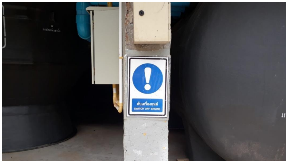
ภาพที่ 3 แสดงป้าย “กรุณาดับเครื่องยนต์ทันที”