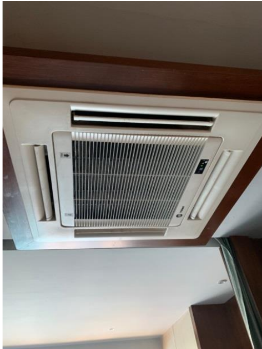
ภาพที่ 21 แสดงระบบแอร์ภายในห้องพัก