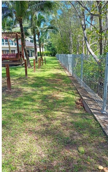
ภาพที่ 11 แสดงร่องน้ำคลอง