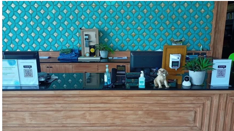
ภาพที่ 33 เจลแอลกอฮอล์และจุดตรวจวัดอุณหภูมิ