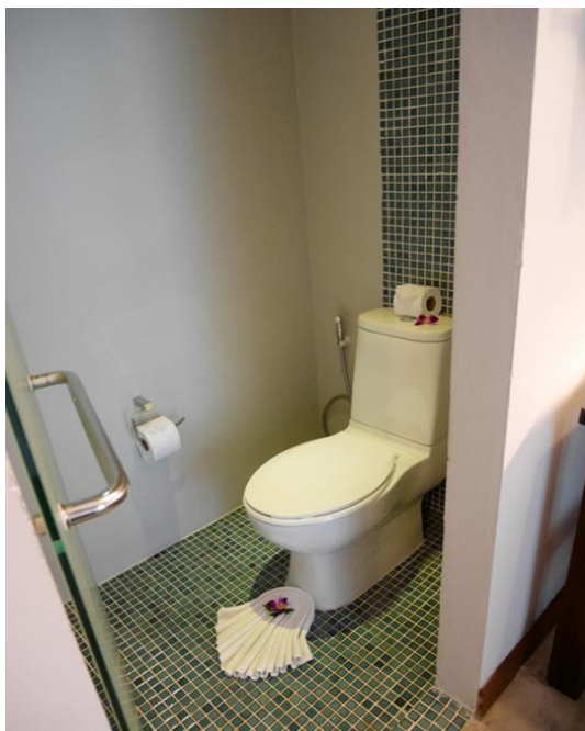
ภาพที่ 10 แสดงโถสุขภัณฑ์และถังขยะภายในห้องพักแขก