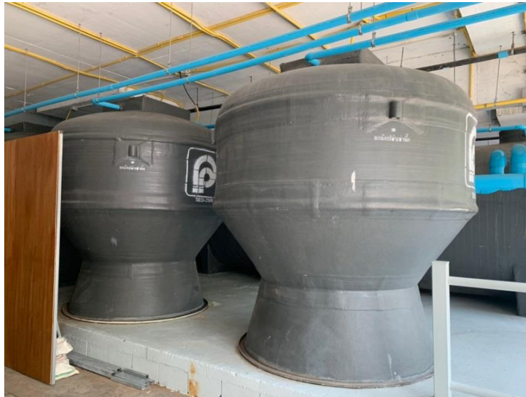
ภาพที่ 5 แสดงจุดบำบัดน้ำเสียรวม