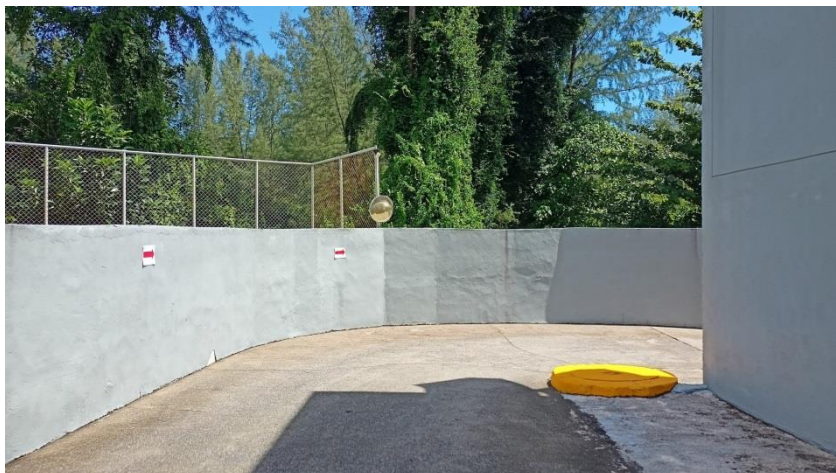
ภาพที่ 9 แสดงกระแสน้ำบริเวณทางโค้ง