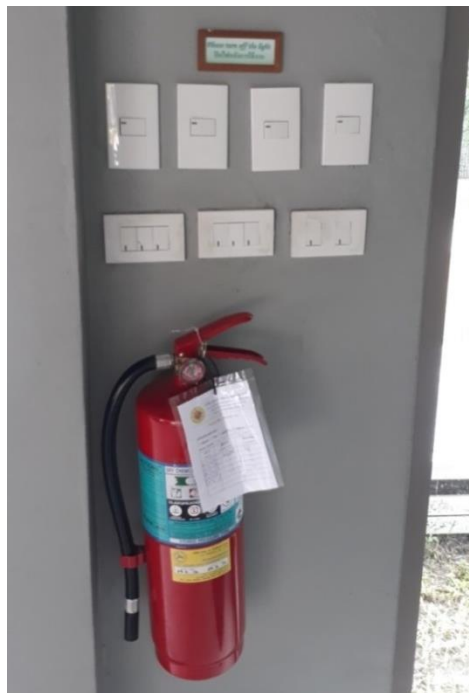
ภาพที่ 22 แสดง “ป้ายปิดไฟหลังการใช้งาน”และถังดับเพลิง