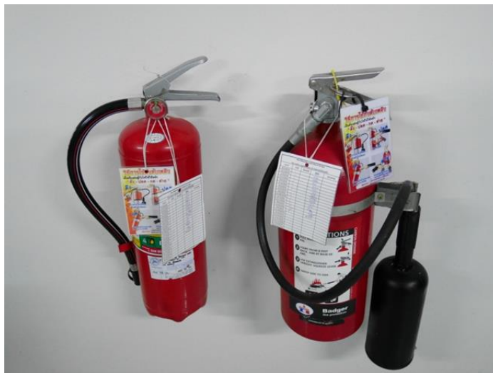
ภาพที่ 31 แสดงถังดับเพลิงชนิดเคมีผงแห้งและวิธีการใช้