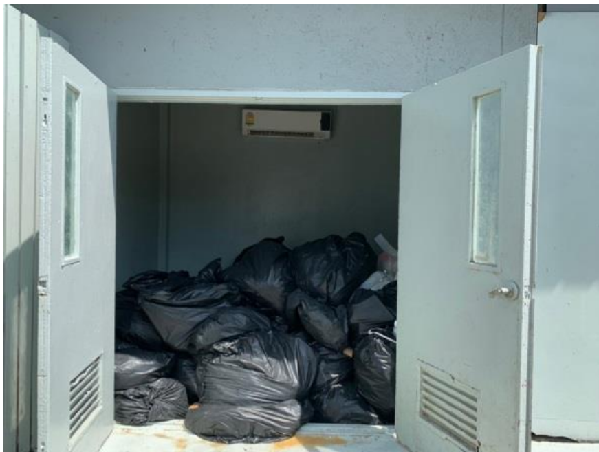
ภาพที่ 15 แสดงห้องพักขยะเปียก